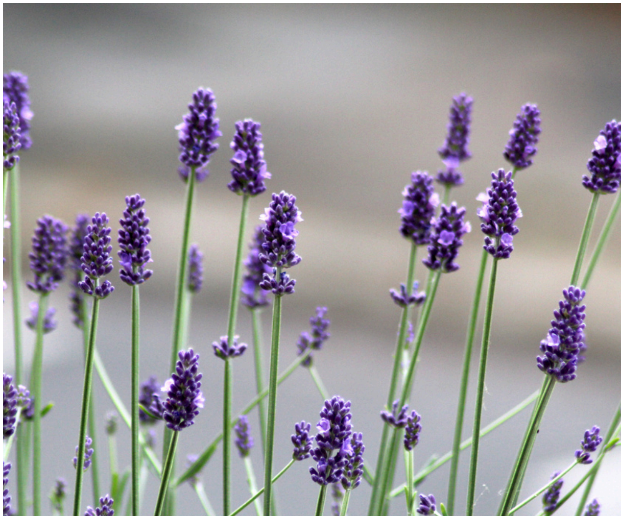
Lavandula x intermedia 'Hidcote Blue'

Bon jardinage et plein de succès, Miriam