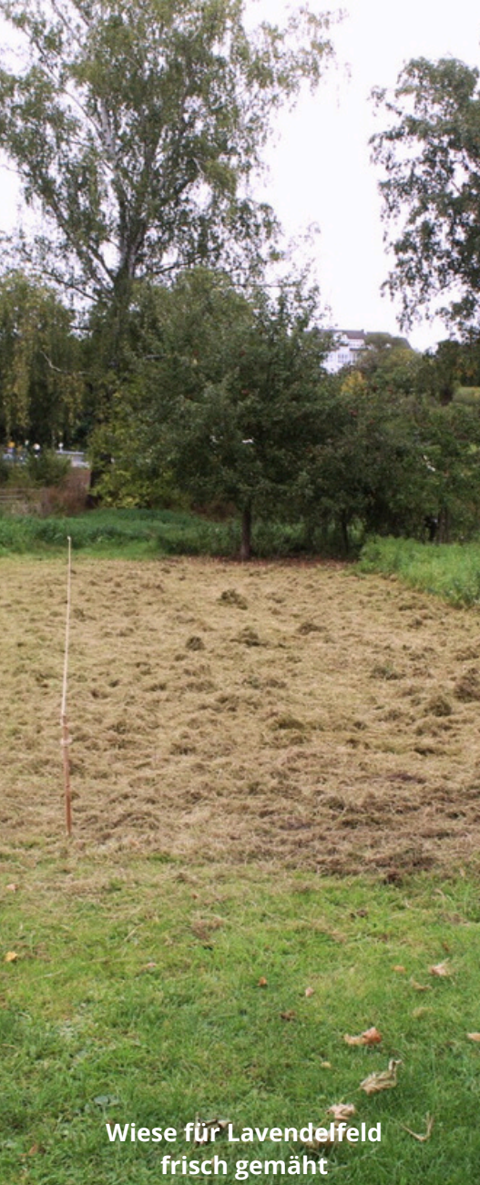
Wiese für Lavendelfeld frisch gemäht