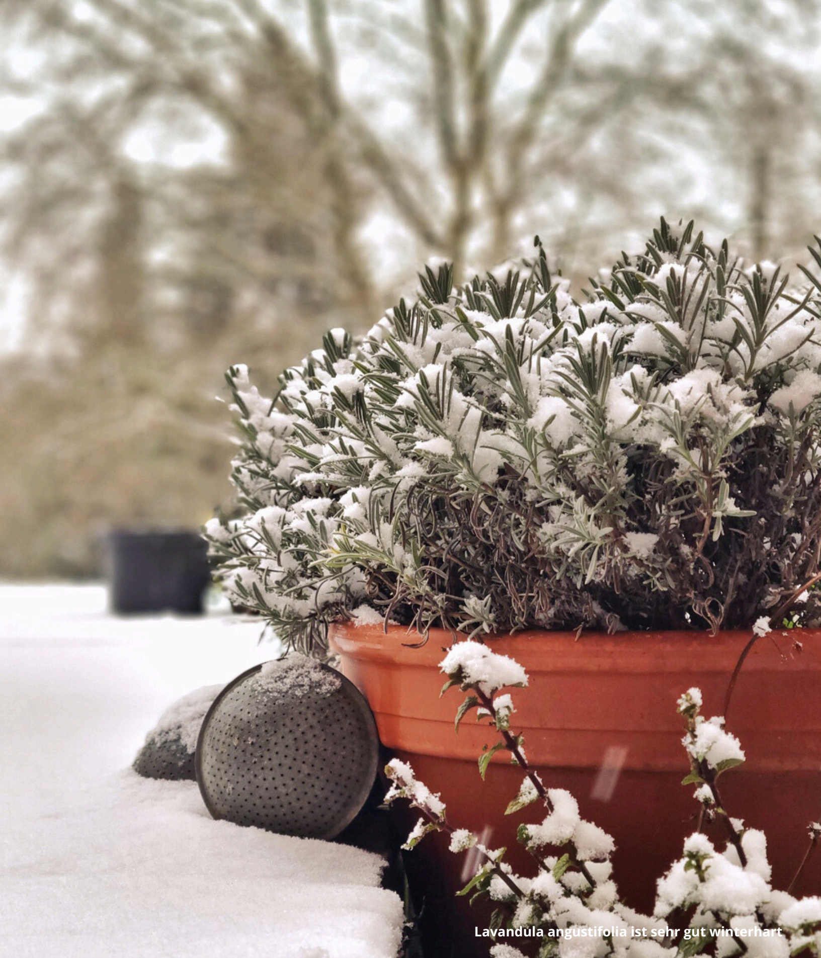
Lavandula angustifolia ist sehr gut winterhart