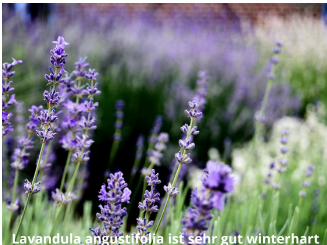
Lavandula angustifolia ist sehr gut winterhart

Zuallererst kommen wir zum Schopflavendel . Ich kann euch kurz und knapp sagen: nicht winterhart! Nicht interessant für mich. Diese Lavendelart schafft es bei uns in Deutschland nur als im CO2-Bilanz-negativen Gewächshaus vorgetriebene einjährige Zierpflanze auf euren Terrassentisch. Zu mehr taugt er nicht.