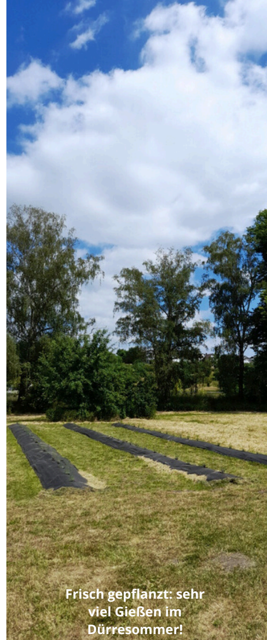
Frisch gepflanzt: sehr viel Gießen im Dürresommer!

Ich habe nach der Frühjahrspflanzung unglaublich viel Zeit damit verschwendet , das Feld zu babysitten. Selbst mit einer professionellen Unkrautsperrwuchse wandelte das Unkraut im Frühjahr „wie Unkraut“. Mein Mann und ich verbrachten Stunden auf den Knien, um dieses lästige und fiese Unkraut zu jäten und