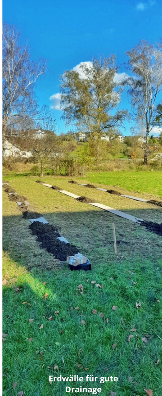
Erdwälle für gute Drainage