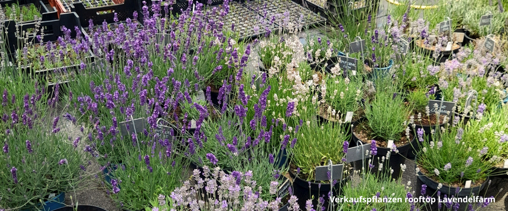
Verkaufspflanzen rooftop Lavendelfarm