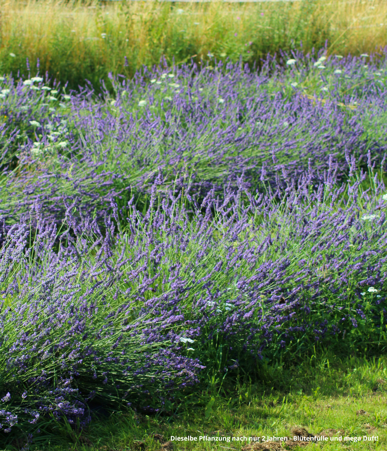
Dieselbe Pflanzung nach nur 2 Jahren - Blütenfülle und mega Duft!