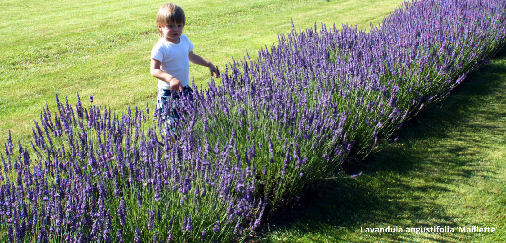
Lavandula angustifolia 'Maillette'