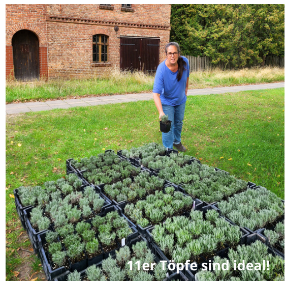
11er Töpfe sind ideal!