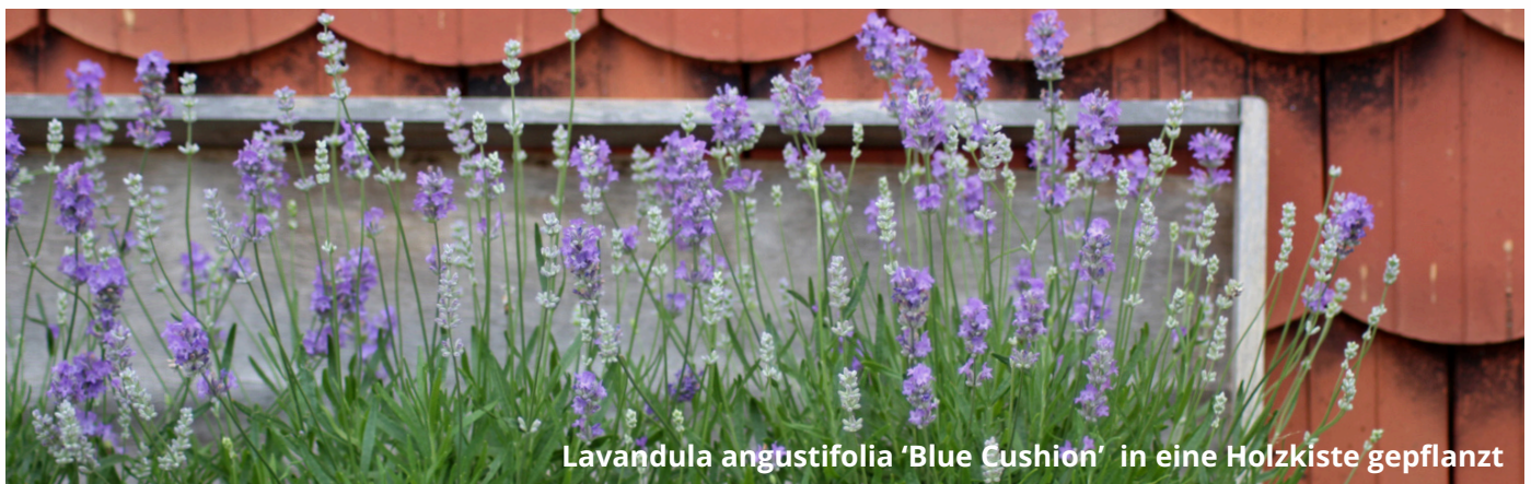
Lavandula angustifolia 'Blue Cushion' in eine Holzkiste gepflanzt