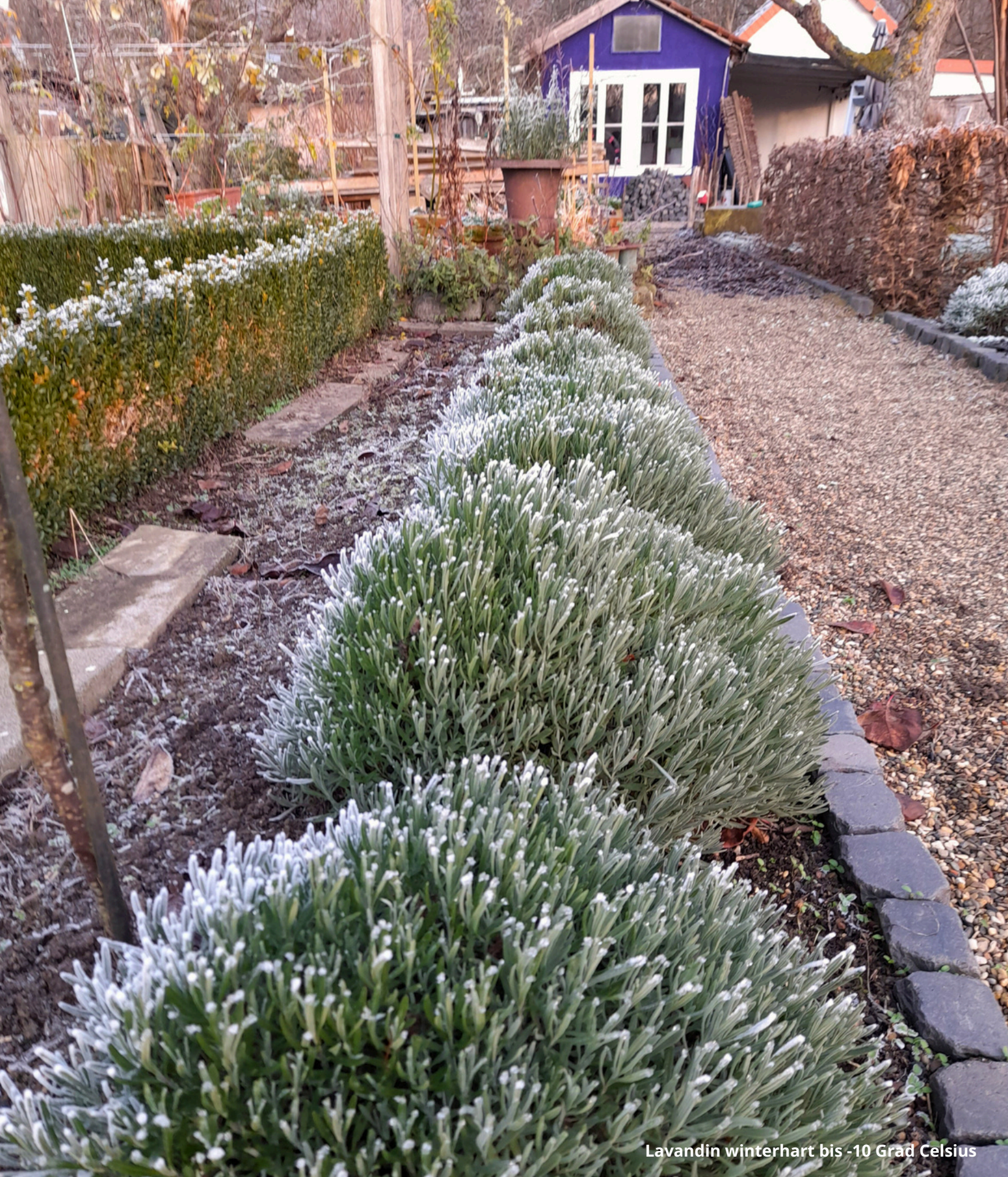
Lavandin winterhart bis -10 Grad Celsius