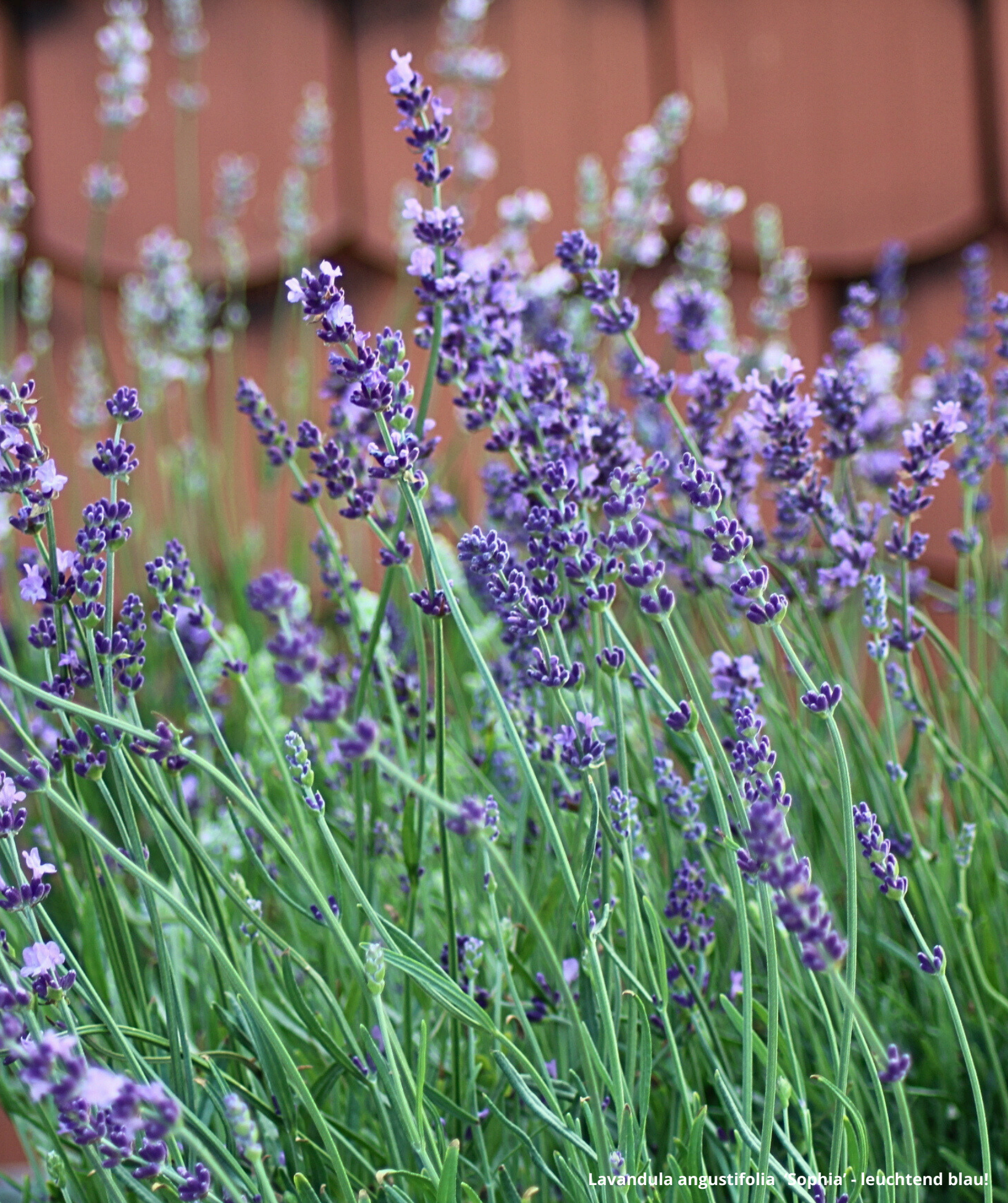
Lavandula angustifolia 'Sophia' - leuchtend blau!