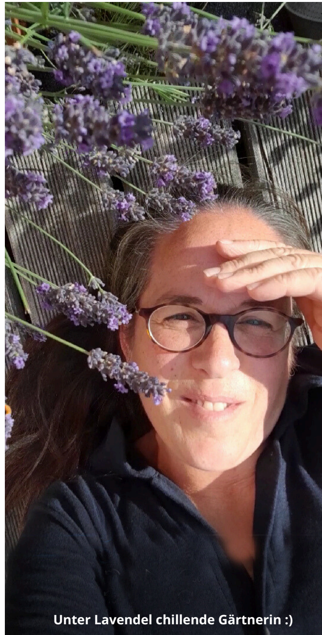
Unter Lavendel chillende Gärtnerin :)

Und ich konnte bequem Mutter Natur das Gießen überlassen, damit sich die kleinen Pflänzchen etablieren konnten!